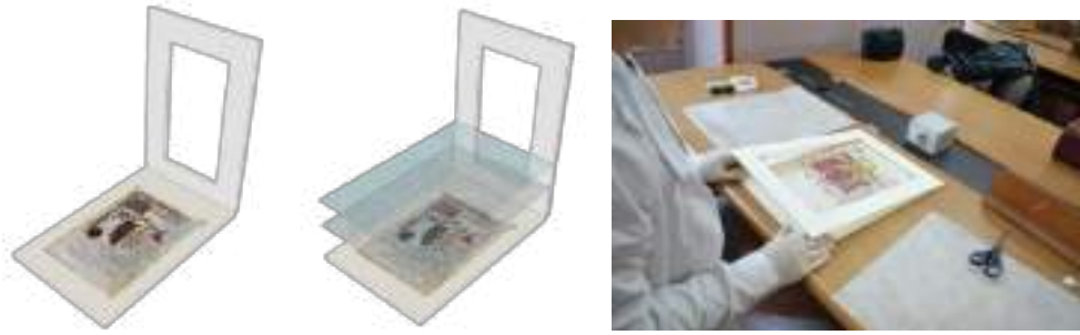
Foto di progettazione e realizzazione dei passe-partout delle carte appartenenti al codice di Santa Marta