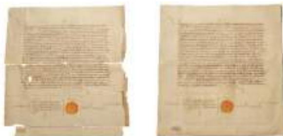
Foto di del prima e dopo l'intervento di restauro.