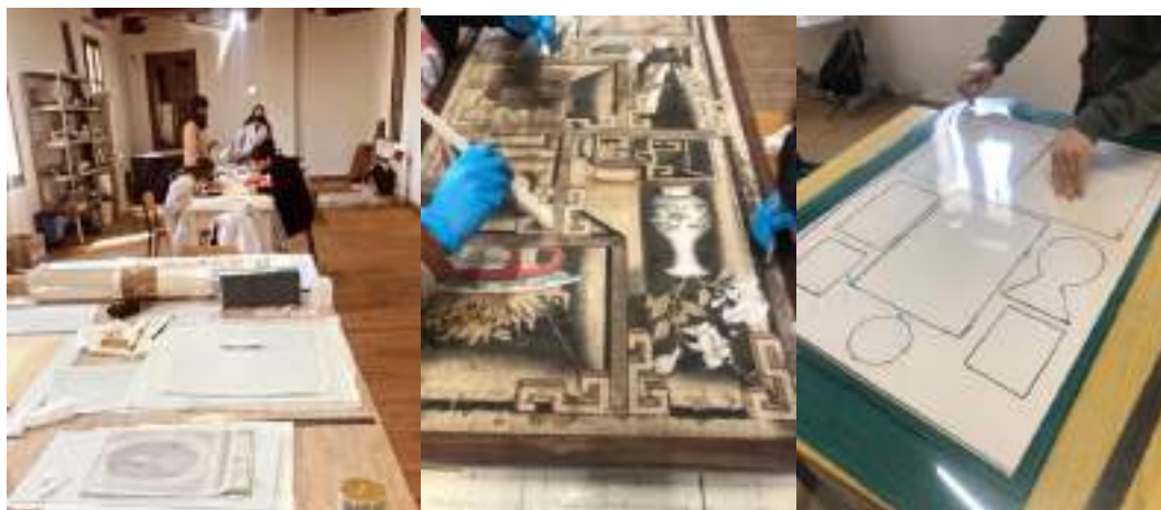
Foto campione del laboratorio di restauro a Stra.

Corso finanziato e , Dgr 1879 del 29/12/2020, approvato con DDR 1099 del 23/12/2020, cod. progetto 463-0002-1879-2020 dal progetto Garanzia Giovani della regione Veneto, n.88 ore di lezioni teorico-pratiche. Le operazioni conservative di restauro sono state svolte presso Villa Pisani a Stra (VE).