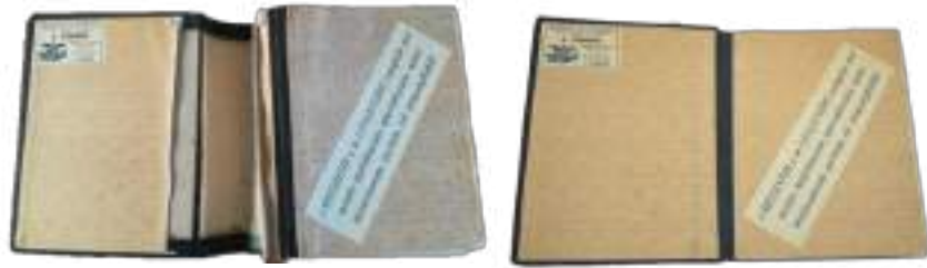
Foto di prima e dopo l'intervento di restauro (particolare intervento alla piega delle carte di guardia)