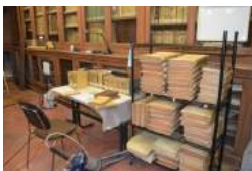
Foto della postazione lavorativa.