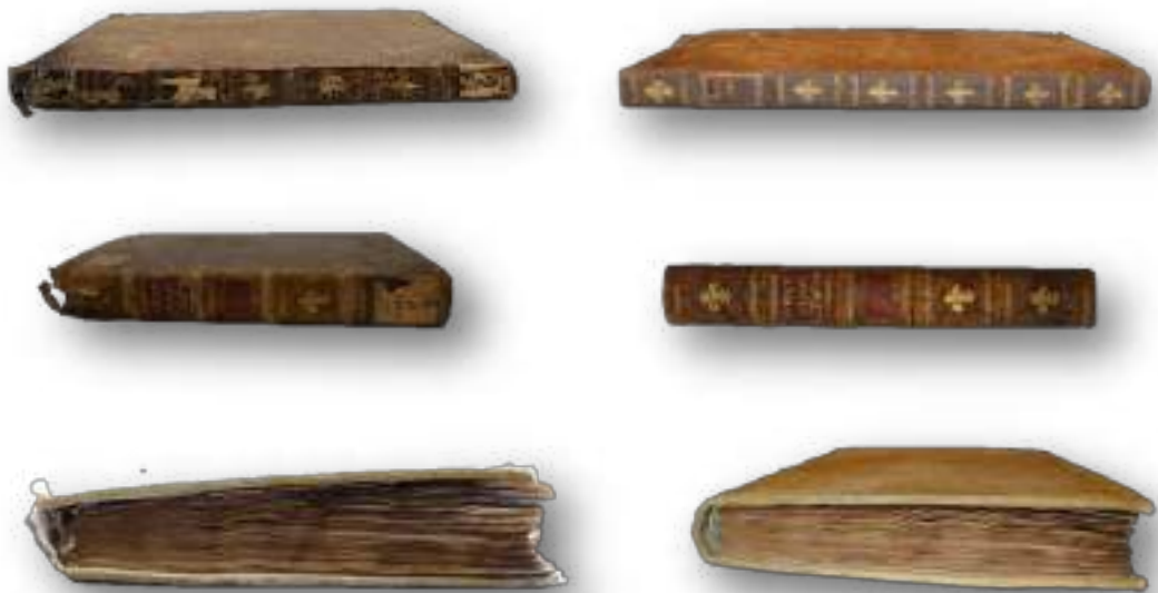
Foto campione del prima e dopo dei tre volumi sottoposti all'intervento conservativo di restauro.