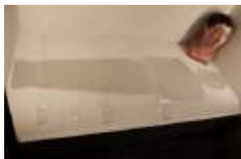
Realizzazione ditta Plexiglass Luigi Conti