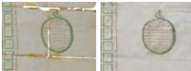
Foto di un particolare della planimetria prima e dopo l'intervento di restauro.