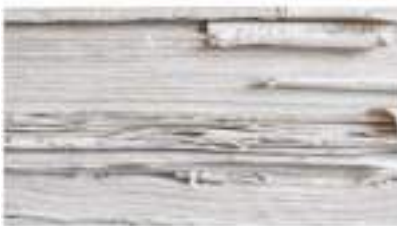
Locandina del convegno Biblioteca Pompejana.

Journal of Archaeology and Epigraphy At Museo Archeologico Nazionale di Napoli