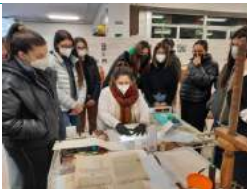
Lezioni frontali con una classe del liceo classico di Cava de' Tirreni.

20/10/2021 - 28/02/2022 • Collaborazione con l'Università di Pavia, Dipartimento di Scienze della Terra e dell'Ambiente per il restauro di n.35 acquerelli originali del Geologo Taramelli in occasione di una mostra in suo onore prevista per il 4/03/2022 in ateneo.