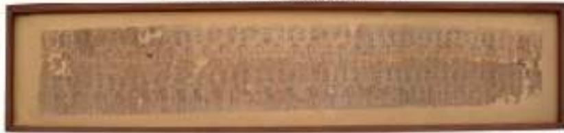
Foto campione: intervento conservativo di restauro eseguito sul papiro funerario custodito presso il Museo Archeologico dell'Università di Pavia.

https://www.facebook.com/unipv.it/posts/1223407364454612