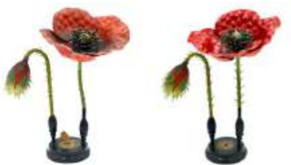
Foto esempio del prima e del dopo l'intervento conservativo di restauro presso l'Università di Pavia.

Intervento conservativo di restauro in loco su circa 150 modelli di morfologia e anatomia vegetale.