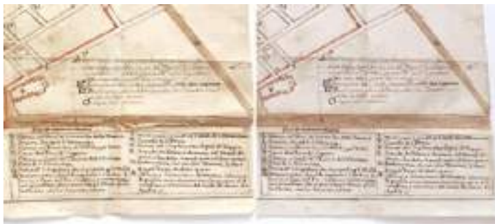
Foto di un particolare della planimetria prima e dopo l'intervento di restauro.