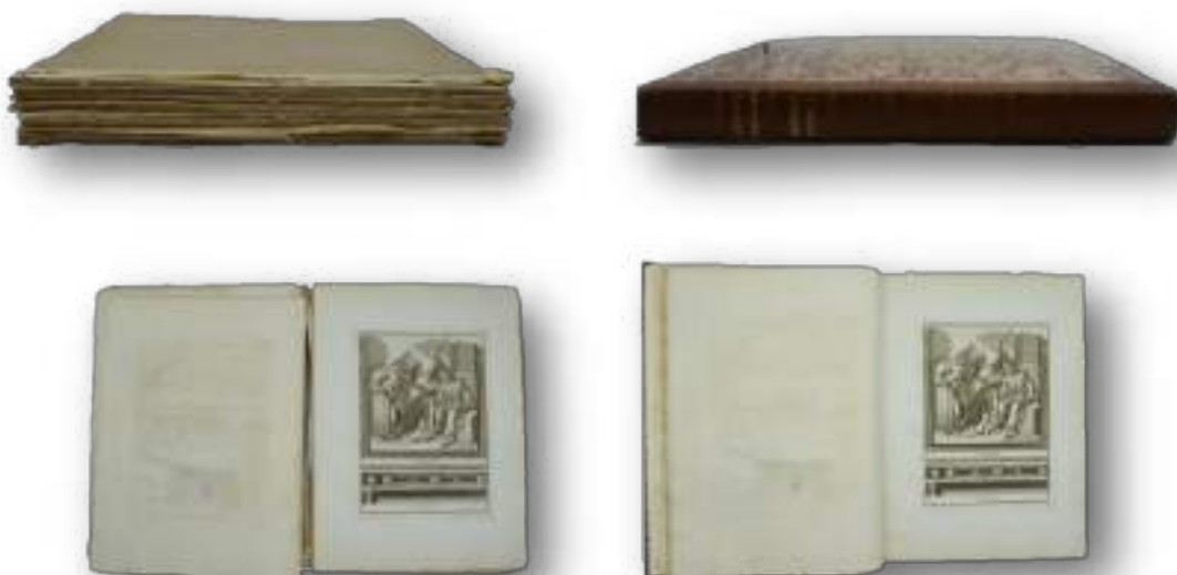
Foto campione del prima e dopo di uno dei volumi sottoposti all'intervento conservativo di restauro.