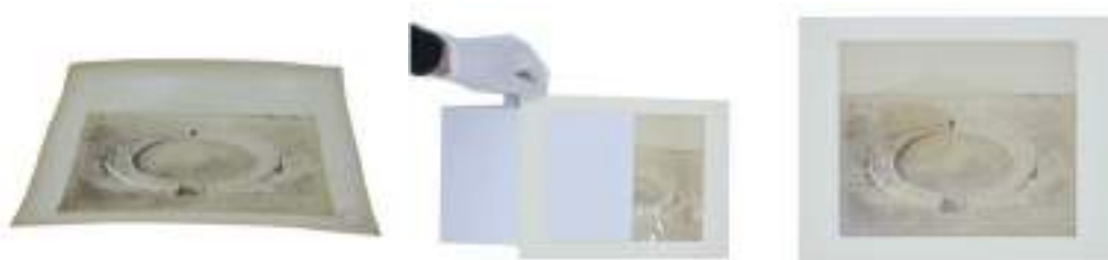
Foto campione del prima e dopo di una albumina trattata e condizionata.

Intervento conservativo di restauro e di condizionamento su di n 95 albumine di diverso formato (dal piccolo al grande) appartenenti all’archivio storico del Museo Archeologico dell’università di Pavia.