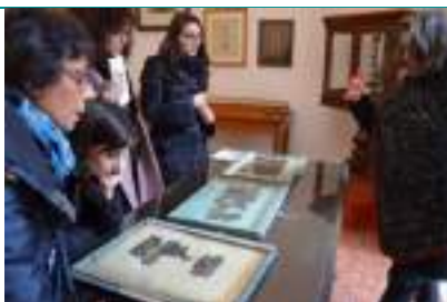
Foto della visita guidata presso la sezione papiri di Ercolano della BNN