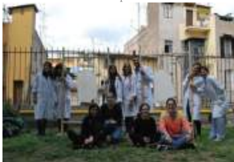
Foto di fine corso

Attività di supporto inquadrata nell'ambito disciplinare Laboratorio di Restauro