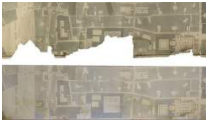
Foto di un particolare della planimetria del 1860 prima e dopo l'intervento di restauro.