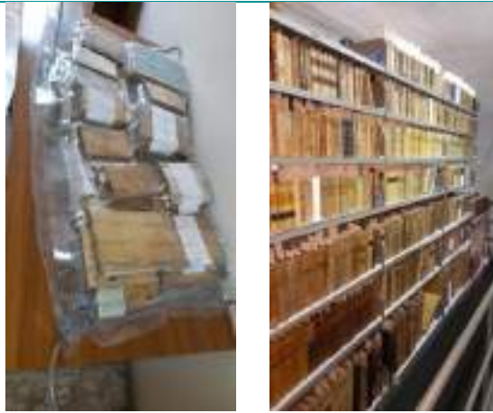
Foto campione degli interventi effettuati: a sinistra un esempio di busta per il trattamento di disinfezione; a destra esito di fine lavoro dei libri trattati riposti su scaffali rivestiti in materiale idoneo alla conservazione.