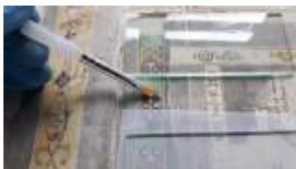
Foto campione: fase di consolidamento del supporto cartaceo perforato da inchiostro metallogallico del Taccuino di William Gell.

N.b.: tra i restauri eseguiti ritroviamo il taccuino di Sir William Gell, manufatto principe della mostra e di inestimabile valore.