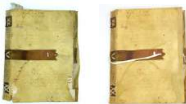
Foto campione del prima e del dopo di uno dei volumi sottoposti all'intervento conservativo di restauro