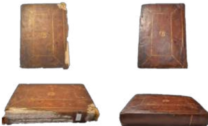
Foto campione dell'intervento conservativo