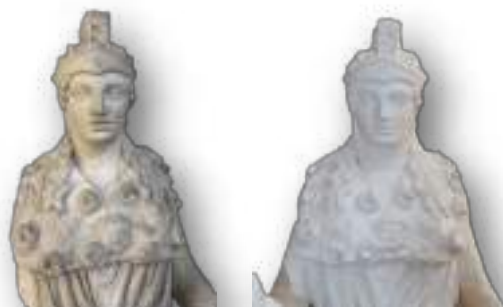
Foto campione di uno dei calchi di gesso prima e dopo il restauro.