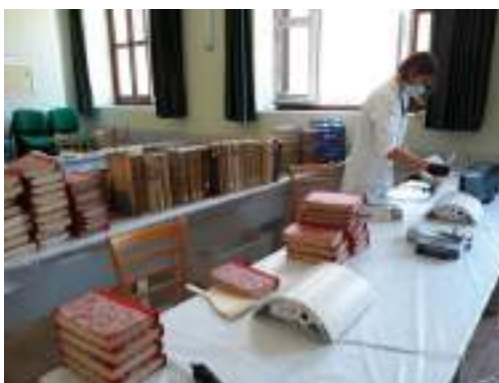
Foto della stanza adibita alle operazioni di ispezione e depolveratura dei volumi.