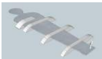
Progetto in 3D di Chiara Argentino