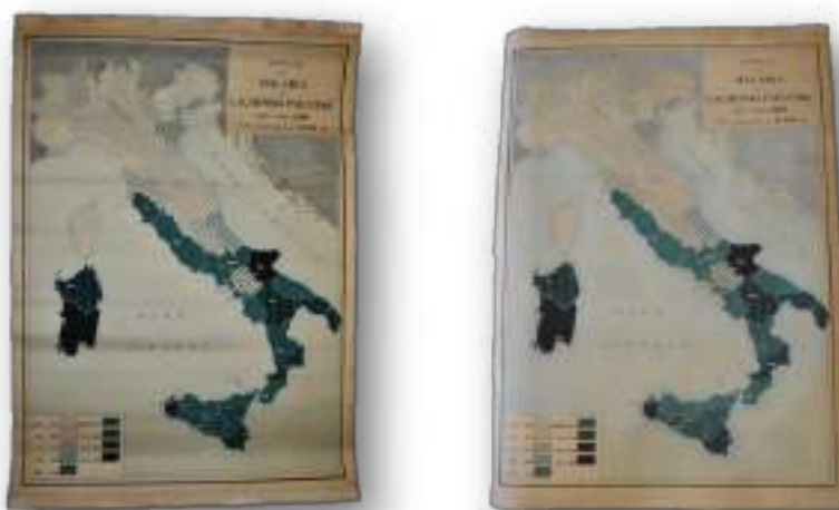
Foto campione del prima e dopo di una delle due mappe geografiche restaurate.