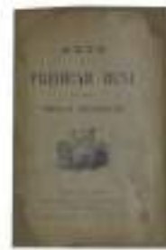
Foto campione del prima e dopo di uno dei volumi sottoposti all'intervento conservativo di restauro.