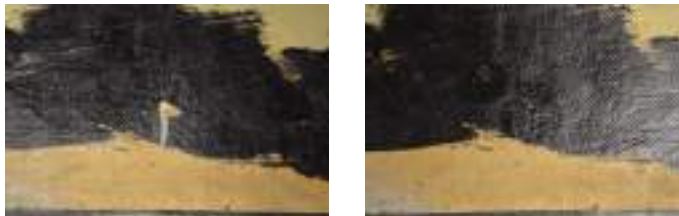
Foto campione: particolare prima e dopo l'intervento di restauro su opera d'arte su cartone telato.

8/03/2018 - ad oggi ● Collaborazione con SINOPIA GALLERIA di Roma per il restauro di opere d'arte su carta (10 incisioni) e di due opere d'arte su cartone telato (opera, tecnica mista).