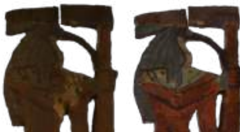
Foto campione: prima e dopo l'intervento del frammento traforato "a giorno" raffigurante Thot

L'intervento conservativo eseguito in loco, ha permesso di recuperare la cromia originaria dei frammenti e di identificare possibili joins che consentono di proporre una ricostruzione del manufatto originario, ossia un Mummy Board, un oggetto che per la sua peculiarità rappresenta quasi un unicum nelle collezioni egittologiche italiane.