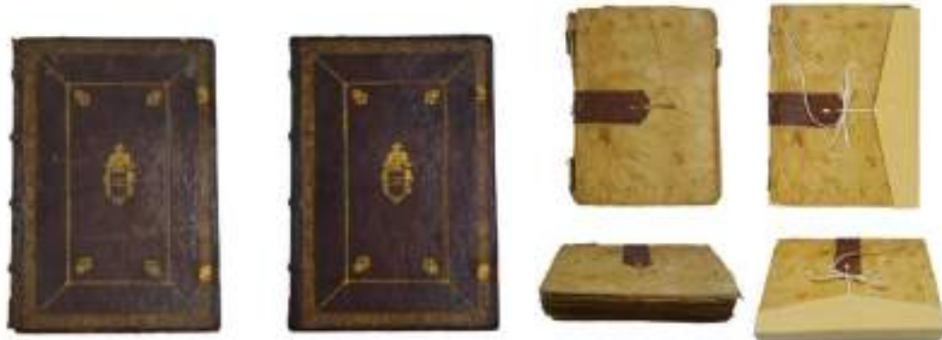
Foto campione del prima e dopo di due dei volumi sottoposti all'intervento conservativo di restauro.