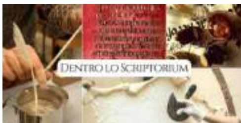
Locandina del corso

Nei due giorni di workshop ci saranno spiegazioni introduttive e esperienze pratiche. Nella prima giornata impareremo le fasi di manifattura della pergamena, come preparare l'inchiostro metallotannico dei manoscritti ricreando la ricetta storica, come preparare il pigmento rosso dei capilettera. Nella seconda giornata costruiremo un calamo e prepareremo una penna d'oca, e con i materiali preparati sperimenteremo la scrittura su pergamena in Onciale, usata nei codici medievali latini e bizantini tra l'VIII e il XIII secolo, come ad esempio il Codex Purpureus Rossanensis .