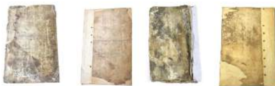
Foto campione del prima e dopo intervento conservativo di un antifonario (coperta membranacea).