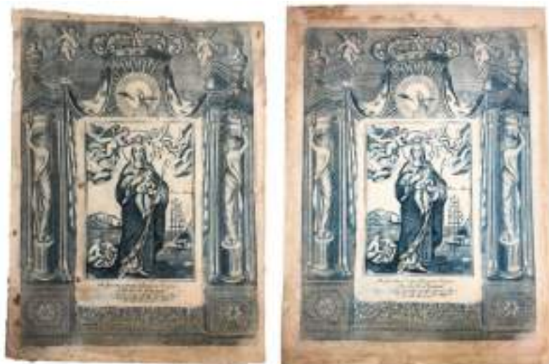
Foto del prima e del dopo l'intervento conservativo di restauro

20/12/2021 • Intervento conservativo di restauro di una incisione sacra appartenente alla Diocesi del Comune di Positano