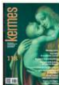
Copertina della rivista