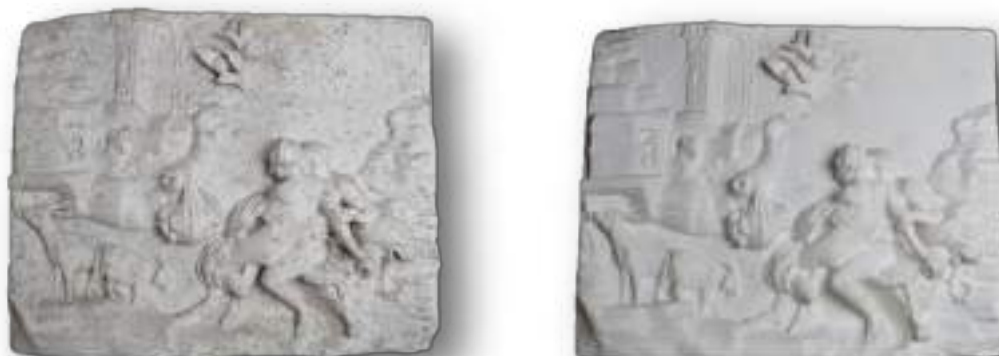
Foto campione del prima e dopo di uno dei calchi in gesso dal titolo: Amori di Polifemo e Galatea.