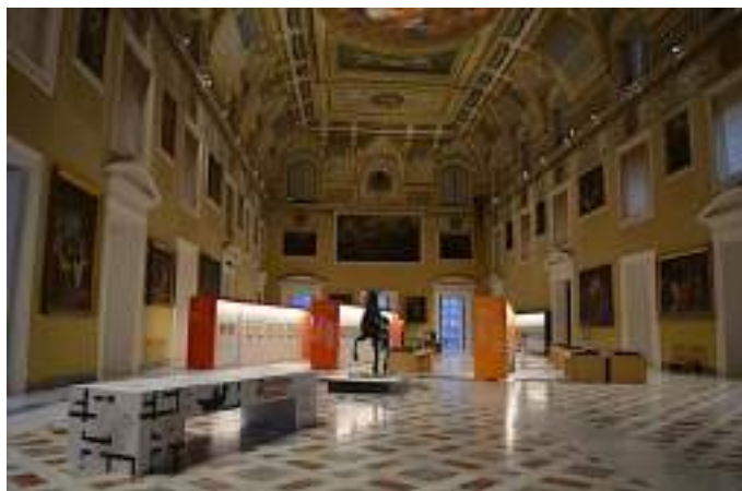
Foto della Sala espositiva della mostra: Sala della Meridiana, Museo Archeologico di Napoli

La mostra "Ercolano e Pompei. Visioni di una scoperta" (in programma al MANN, nella sala della Meridiana, dal 28 giugno al 30 settembre 2018), è un percorso nelle suggestioni che le città vesuviane, sepolte dall'eruzione del 79 d.C. e svelate dagli scavi del XVIII secolo, hanno esercitato su interpreti d'eccezione, vissuti tra il Settecento e gli inizi del Novecento. Il percorso espositivo, nato dalla sinergia del Museo Archeologico Nazionale di Napoli con il centro culturale m.a.x. di Chiasso, è, dunque, una narrazione a ritroso nel tempo, le cui tappe non sono soltanto segnate da venticinque preziosi reperti archeologici, ma anche da lettere, taccuini acquerellati, incisioni, litografie, disegni, rilievi, matrici, gouaches, fotografie e cartoline.